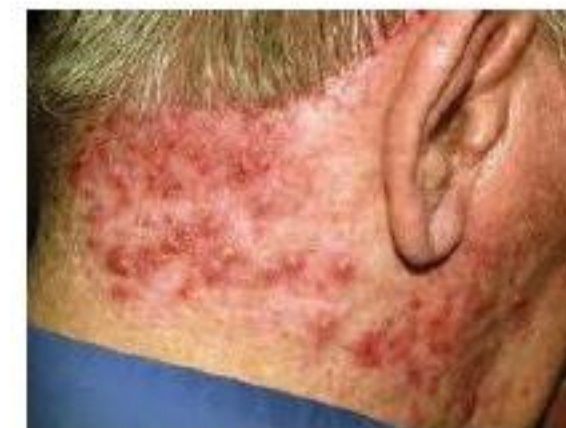
Neck Infection Folliculitis