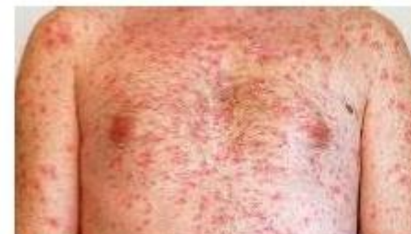
Body Skin Infections