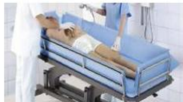
For Bathing Patients In Hospital