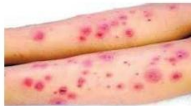
Legs Skin Infections

يببل كامل الجسم والليفة ويوضع عليها كمية كافية من الجل ثم يفرك وينظف الجسم كالمعتاد لمدة دقيقتين وخاصة بعد الاستحمام في حمامات السباحة أو في البحر .