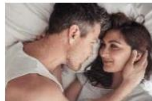
For Safe Sexual Relations

SANITIZER AND CLEANSER FOAMING BODY GEL BACTERICIDAL, VIRUCIDAL, FUNGICIDAL RELIES ON THE NEWEST ADVANCED OXIDATION TECHNOLOGY