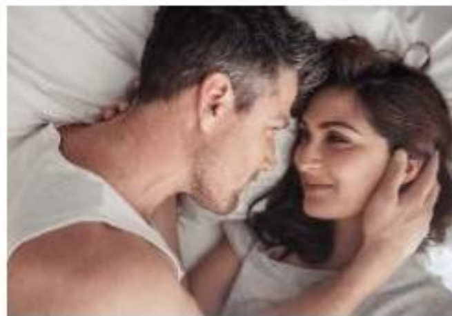
For Safe Sexual Relations