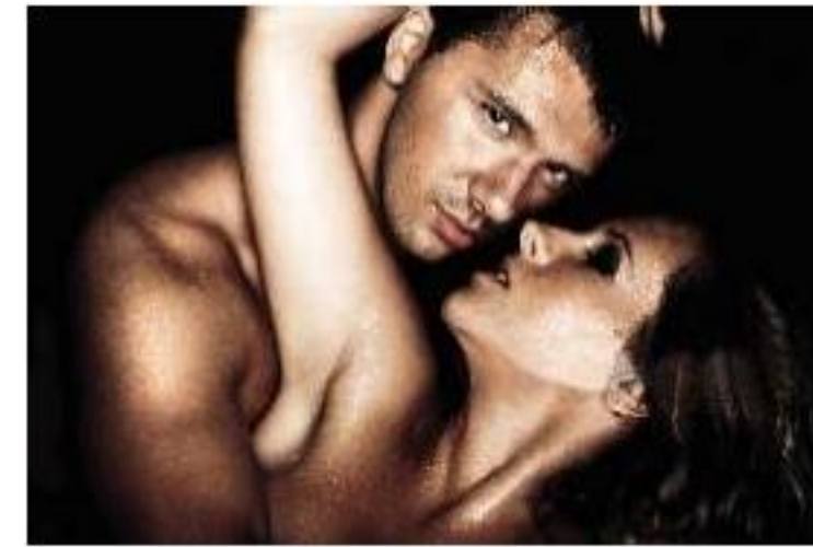
For Safe Sexual Relations