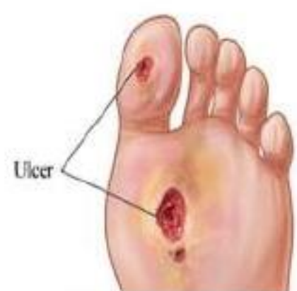
Diabetic foot ulcer