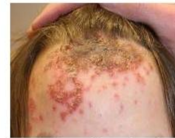
Impetigo Skin Infection