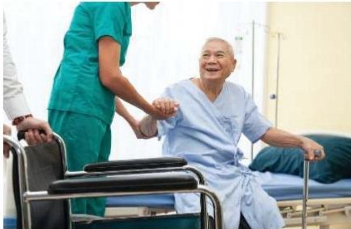
Healthy and Safe Environment