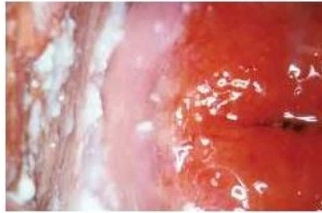
Female Genital Infections

FEMININE HYGIENE FOAMING GEL BROAD SPECTRUM DISINFECTANT FOR SENSITIVE MUCOSA AND GENITALS RELIES ON KILLING BACTERIA BY THE MOST RECENT TECHNOLOGY (ADVANCED OXIDATION TECHNOLOGY)